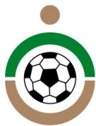
Fundación del Fútbol Andaluz

«Contar con el Fútbol» es una marca registrada de la Federación Andaluza de Fútbol (FAF).